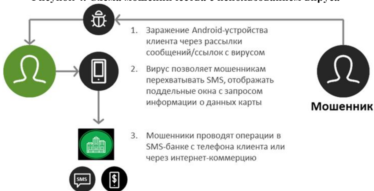
Рисунок 4. Схема мошенничества с использованием вируса

Владелец смартфона получает сообщение, в его тексте ссылка, которая при открытии инициирует загрузку вирусной программы. Как только вирус попадает в смартфон, он начинает рассылать «вирусные» СМС по контактному листу пользователя. Параллельно он делает запрос на номер СМС-банкинга и узнает баланс счета владельца смартфона. После этого вирусная программа переводит деньги на счета, подконтрольные злоумышленникам. Вирус способен перехватывать входящие СМС-сообщения, поэтому владелец смартфона может не знать о снятии денег со счета, оповещения о списаниях просто не доходят. Кроме того, вирус может открывать окна браузера, визуально похожие на окна авторизации банковских приложений, и при вводе данных своих карт пользователи отправляют средства напрямую мошенникам. В некоторых случаях вирус может блокировать смартфон.