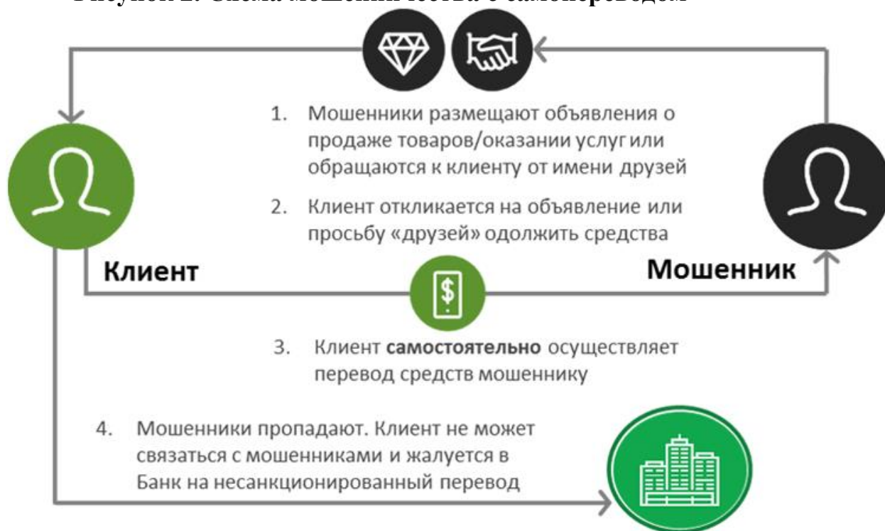
Рисунок 2. Схема мошенничества с самопереводом

В последнее время самопереводы чаще делают не пенсионеры, а молодые люди в возрасте от 18 до 30 лет. Так, в апреле этого года в Иркутске сотрудники полиции задержали интернет-мошенницу — ей оказалась 28-летняя женщина, которая размещала на Avito объявления о продаже детских кроваток и колясок. Мошенница тщательно подбирала в Интернете красочные картинки, ставила низкую цену, а покупатели радостно попадались на крючок. В итоге пострадало не менее 20 жителей области и близлежащих регионов. Позвонив по номеру телефона, указанному в объявлении, покупатели беседовали с «сотрудницей крупной компании из Новосибирска», которая