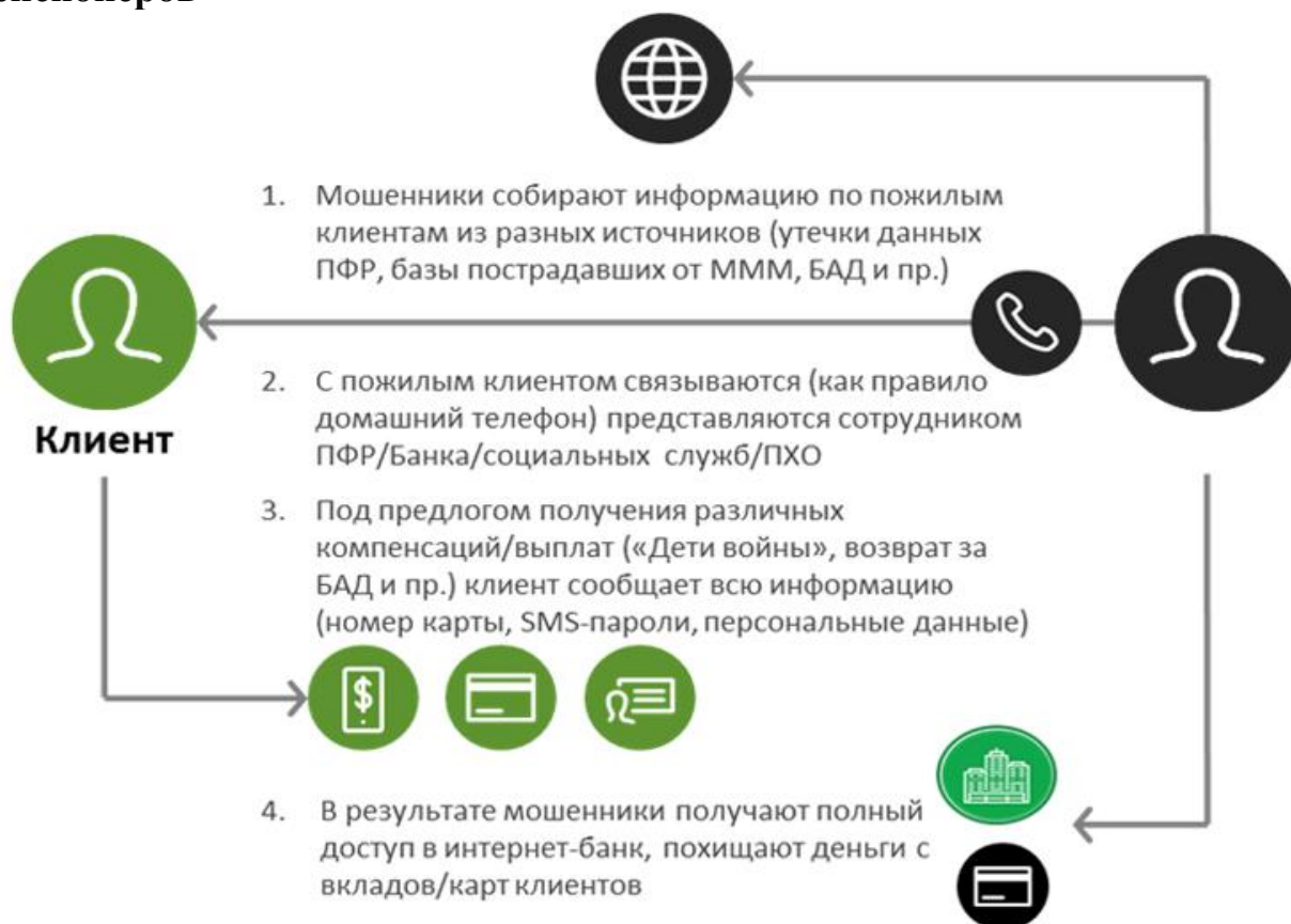
Рисунок 3. Наиболее распространенный вариант схемы обмана пенсионеров

В конце прошлого года в Сбербанк обратилась пенсионерка, являющаяся его клиентом, и сообщила, что мошенники обманом вынудили ее перевести на их карты почти полмиллиона рублей (деньги она откладывала на похороны).